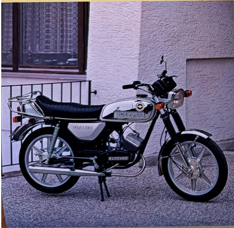
◀ GTS 50 – Das Super-Mokick

Als Modell '79 noch attraktiver, setzt neue Maßstäbe für Sicherheit, Komfort und Sportlichkeit. In Aussehen und Technik wie ein 50-cm 3 -Motorrad. Ist aber ein Mokick. Der neue, rechteckige Breitbandscheinwerfer leuchtet die Fahrbahn noch besser aus. Die große Sicherheits-schlußleuchte mit integriertem Bremslicht reagiert auf Hand- und Fußbremse. Das neue Doppelcockpit ist mit vollkommen neu entwickeltem Tachometer und Drehzahlmesser ausgerüstet. Sie sind anzeigege-nau und bei Tag und Nacht gut ablesbar. Die vergrößerten Blinker haben Sicherheits-Seitenstrahler. Die sportliche Stufen-Sitzbank mit Heckspoiler bietet 2 Personen bequem Platz. Motorkraft und Federung sind optimal aufeinander abgestimmt. Die hinteren Federbeine lassen sich dreifach verstellen. Der 2,1-kW-Motor mit 4-Gang-Fußschaltung meistert mühelos Bergstraßen bis zu ca. 44% Steigung. Das ist super – jeder Zoll echte ZÜNDAPP-Qualität.